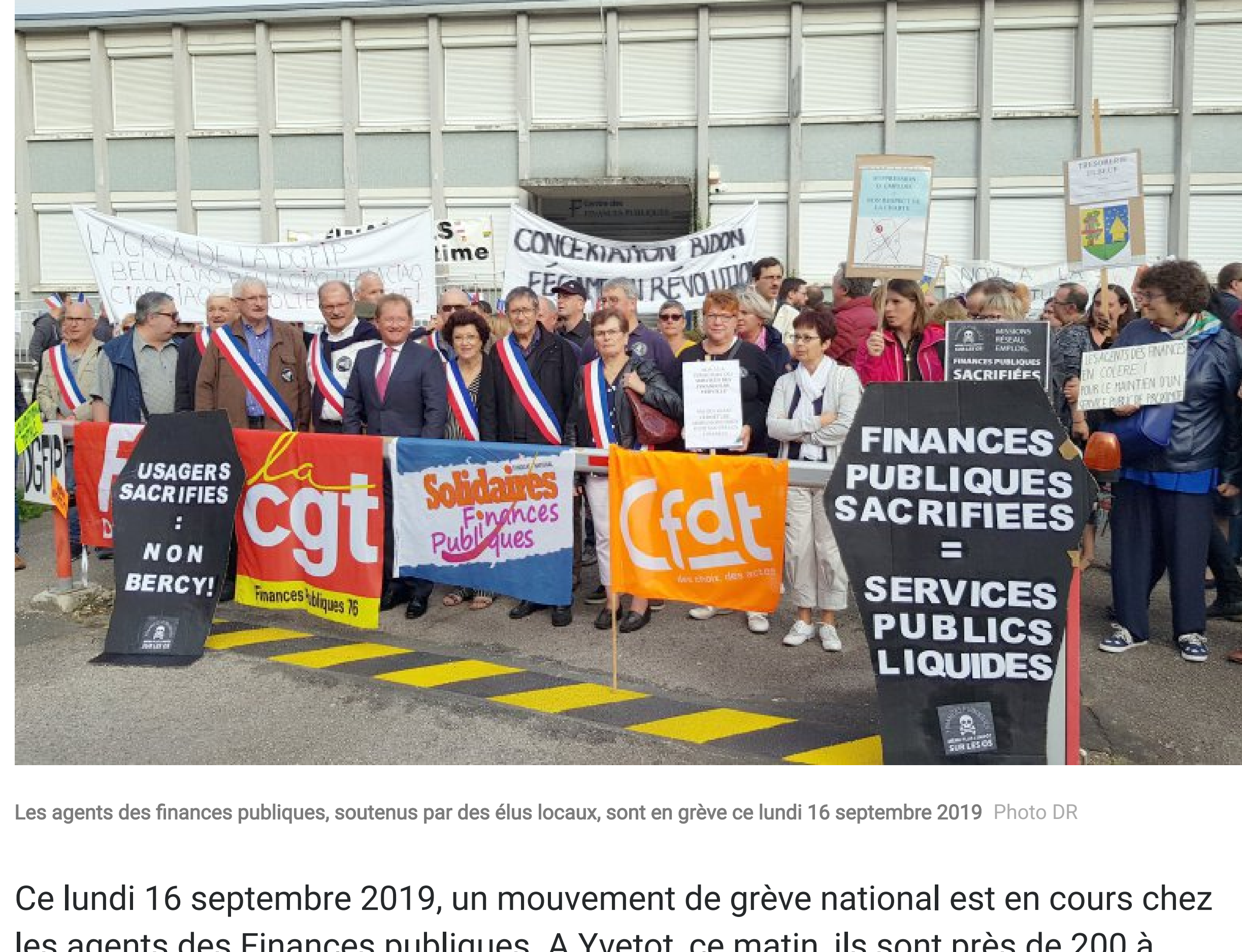
Les agents des finances publiques, soutenus par des élus locaux, sont en grève ce lundi 16 septembre 2019

10:51 - 16/09/2019 Par Le Courrier Cauchois 0 Commentaire