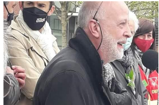
Présence du Petit-fils d'Ambroise Croizat