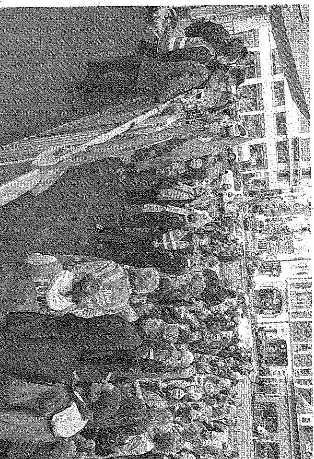
Une centaine de personnes se sont retrouvées devant la trésorerie de Dieppe pour manifester son opposition au projet de réforme des services publics.